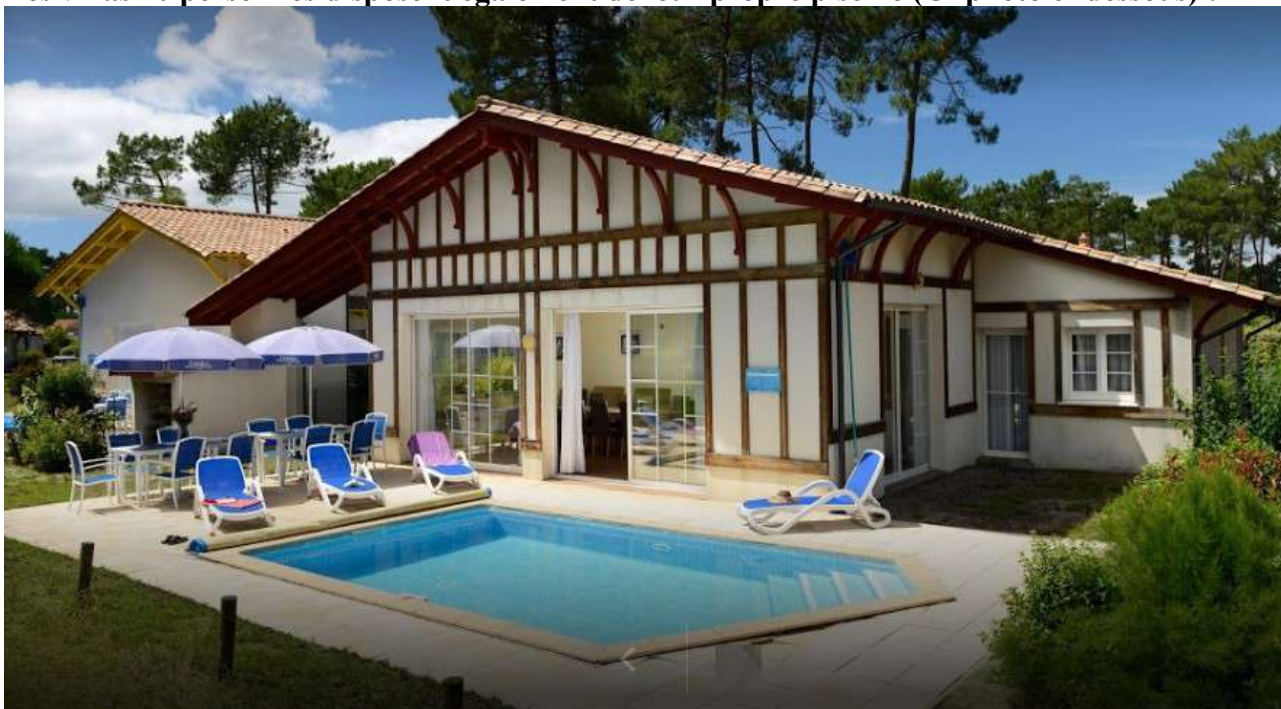
Villa 10 personnes

Les villas 10 personnes disposent également de leur propre piscine (Cf photo ci-dessous) :