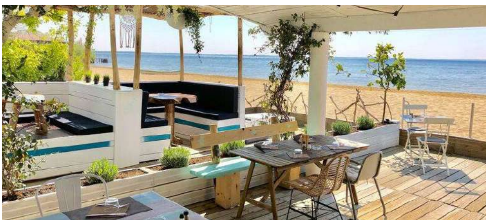
plage du lac de Cazeaux (devant le bar LE BO SITE)