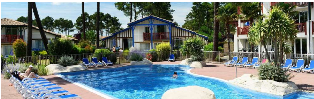
La résidence du séjour