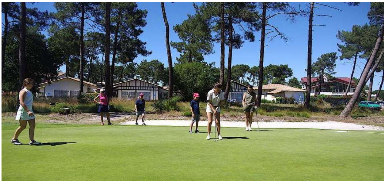
Golf de Gujan Mestras (la résidence Odalys est située juste derrière)