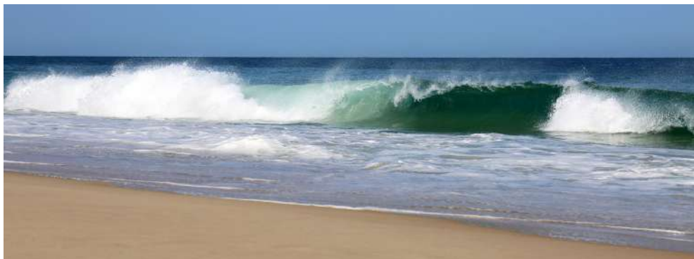
plage de la lagune

Rendez-vous dès le dimanche à 14h55 devant la réception de la résidence Odalys pour organiser le covoiturage, puis départ à 15h00 précise.