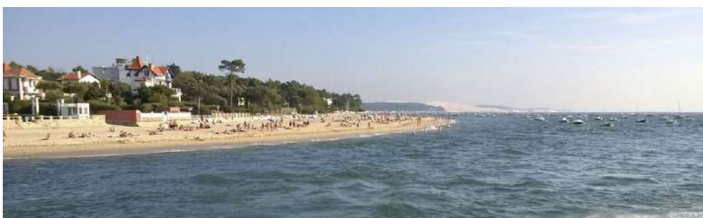
plage du Moulleau à Arcachon