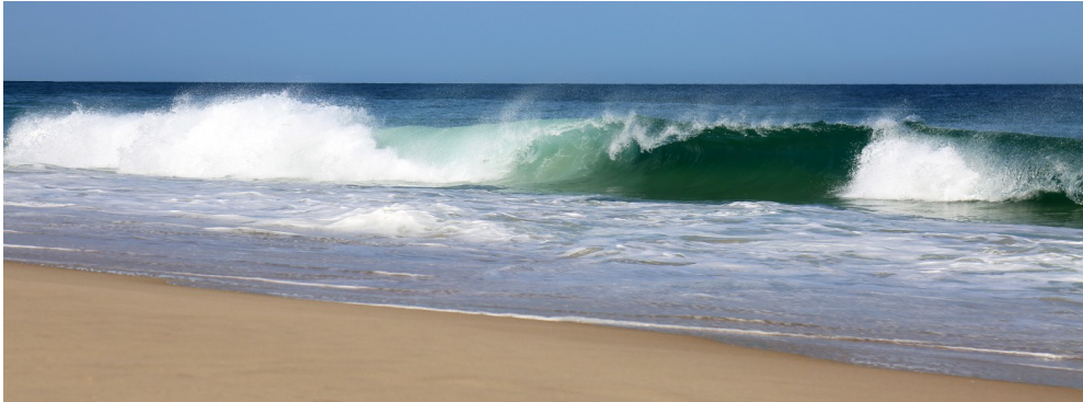
plage de la lagune

Rendez-vous dès le dimanche à 14h55 devant la réception de la résidence Odalys pour organiser le covoiturage, puis départ à 15h00 précise.