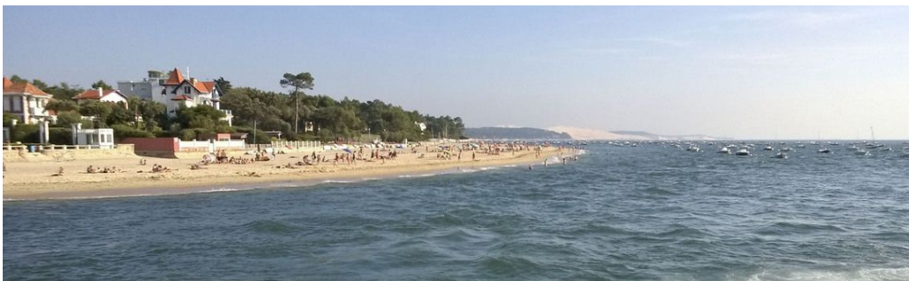
plage du Moulleau à Arcachon