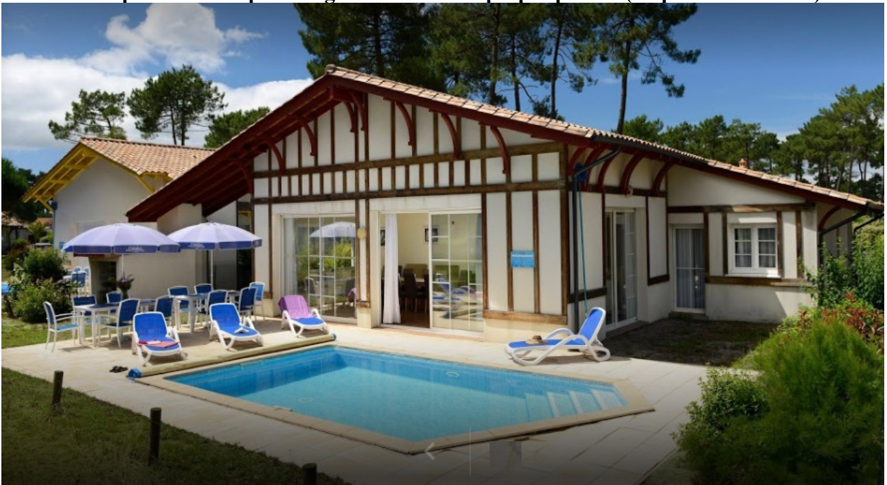
Villa 10 personnes

Les villas 10 personnes disposent également de leur propre piscine (Cf photo ci-dessous) :