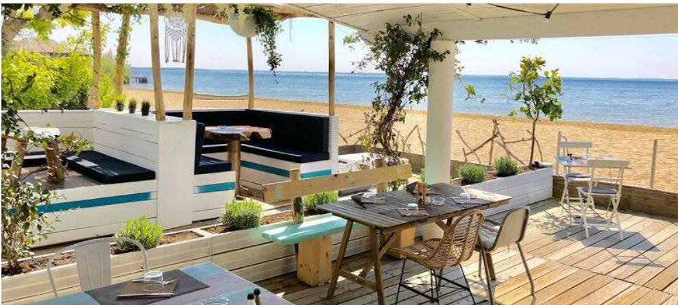
plage du lac de Cazeaux (devant le bar LE BO SITE)