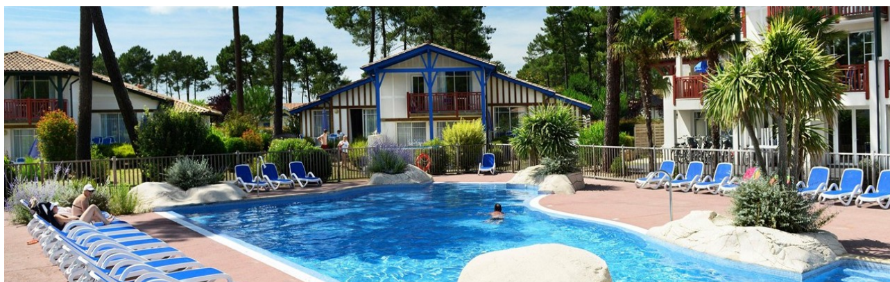
La résidence du séjour