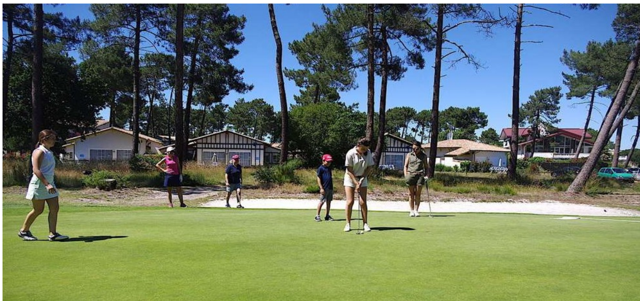
Golf de Gujan Mestras (la résidence Odalys est située juste derrière)