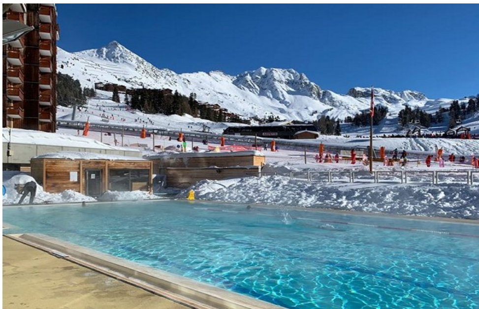
Piscine de la station, située à 50 mètres de la résidence (accès gratuit à tous les inscrits au séjour)

Il sont situés dans le complexe de la piscine (en bord de piscine). Tarif : environ 16 € la semaine ou 6 € la journée.