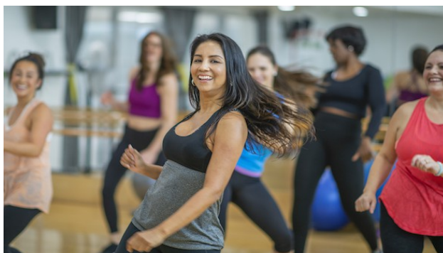
Cours de danse tous les matins

40 € le pass de 6 matinées à régler en ligne uniquement.